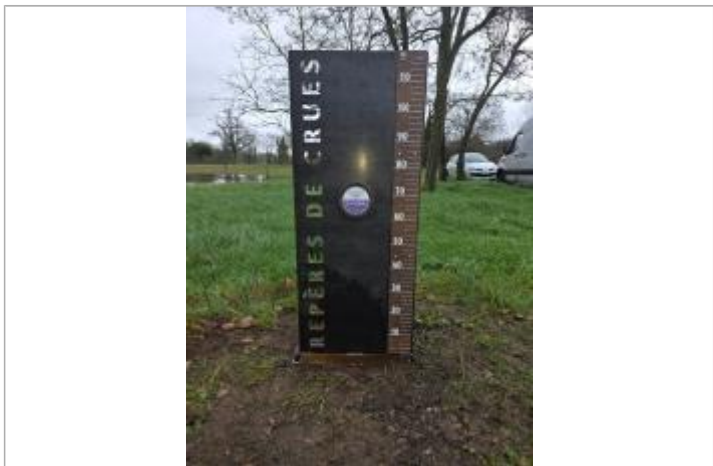
Repère BEAU02-R installé sur un totem

MARQUE Texte : Décembre 1982 Le Clain Maximum de l'inondation : Oui Visibilité : Oui État du repère : Bon Pérennité : Longue Repère calculé : Oui PHEC : Oui