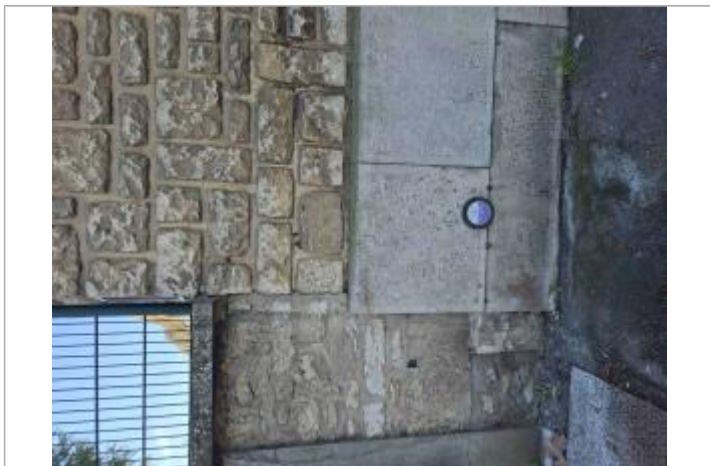
Repère POIT15-R sur le mur du collège du Jardin des Plantes

Texte : Décembre 1982 Le Clain Maximum de l'inondation : Oui Visibilité : Oui État du repère : Bon Pérennité : Longue Repère calculé : Non PHEC : Oui