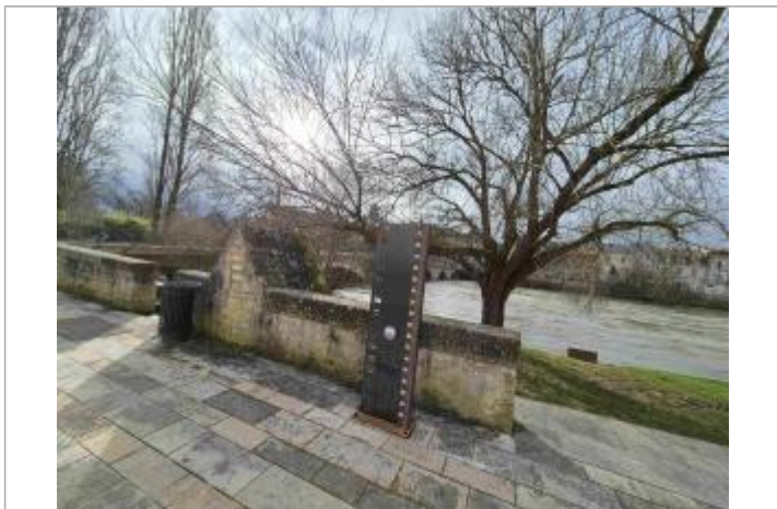
Repère POIT09-R installé sur un totem à proximité de la Fontaine du Pont Joubert

Texte : Décembre 1982 Le Clain Maximum de l'inondation : Oui Visibilité : Oui État du repère : Bon Pérennité : Longue Repère calculé : Non PHEC : Oui