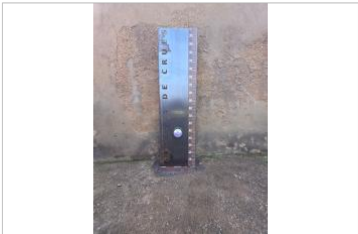
Repère POIT06-R installé sur un totem Boulevard Anatole France

GÉNÉRAL Code : POIT06-R Date de mise à jour : Auteur : EPTB_Vienne 30/03/2026