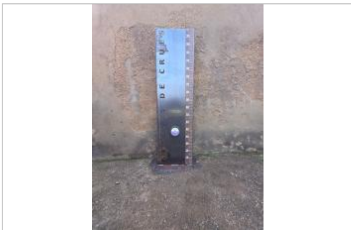
Repère POIT06-R installé sur un totem Boulevard Anatole France

Texte : Décembre 1982 Le Clain Maximum de l'inondation : Oui Visibilité : Oui État du repère : Bon Pérennité : Longue Repère calculé : Non PHEC : Oui