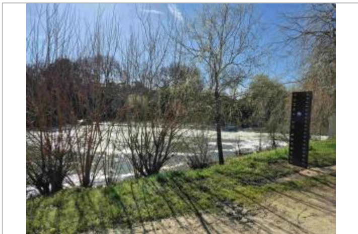
Repère POIT04-R installé sur un totem le long du Clain près du barrage

Texte : Décembre 1982 Le Clain Maximum de l'inondation : Oui Visibilité : Oui État du repère : Bon Pérennité : Longue Repère calculé : Non PHEC : Oui