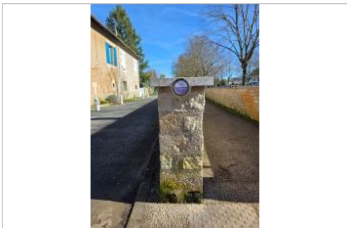
Repère POIT02-R installé sur un muret Rue du Bas des Sables

GÉNÉRAL Code : POIT02-R Date de mise à jour : 30/03/2026 Auteur : EPTB_Vienne