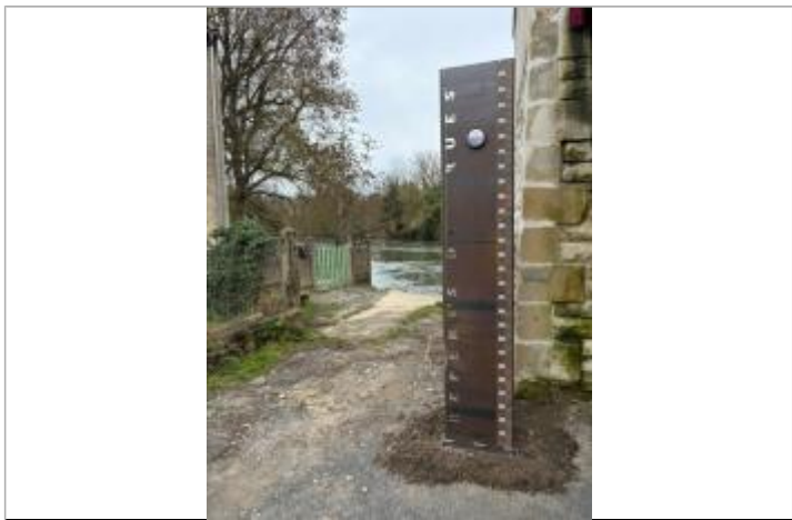
Repère POIT01-R installé sur un totem

MARQUE Texte : Décembre 1982 Le Clain Maximum de l'inondation : Oui Visibilité : Oui État du repère : Bon Pérennité : Longue Repère calculé : Oui PHEC : Oui