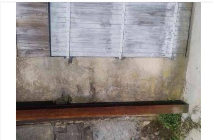
Vue sur le support (entre le pilier de soutien et le volet)

GÉOLOCALISATION Coordonnées WGS84 : X: 0.33937800 / Y: 46.59115100 Coordonnées RGF93 (Lambert 93) X: 496337.19 / Y: 6613554.42 Coordonnées RGF93 (ETRS89) : X: 0.339378 / Y: 46.591151 Code Hydro: L2--0160 Rive de référence: Gauche