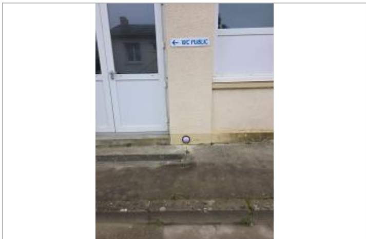
Repère installé sur le bâtiment du judo-club

MARQUE Texte : Décembre 1982 Le Clain Maximum de l'inondation : Oui Visibilité : Oui État du repère : Bon Pérennité : Longue Repère calculé : Non PHEC : Oui