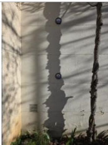
Repères STBE03-R (en bas) et STBE04-R implantés à l'arrière de la mairie

Altitude calculée de l'eau (en m) : 74.69 m