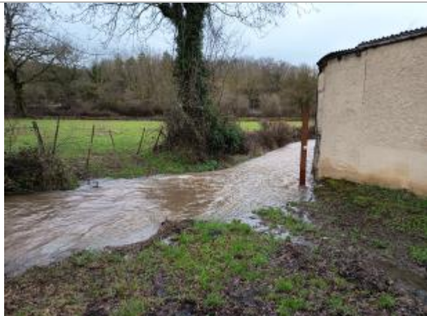
Repère de la crue du 4 mai 1999 du Lugagnac au niveau du lotissement de Beauséjour à Bertholène