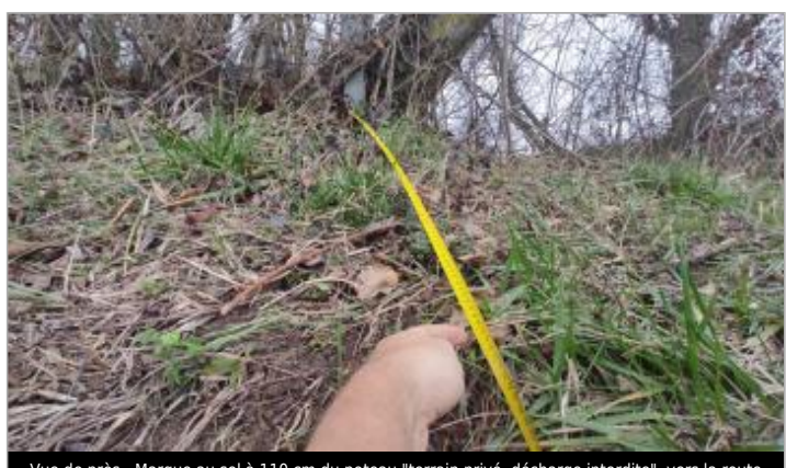
Vue de près - Marque au sol à 110 cm du poteau "terrain privé, décharge interdite", vers la route

MARQUE Maximum de l'inondation : Oui Visibilité : Oui État du repère : Moyen Pérennité : Aucune