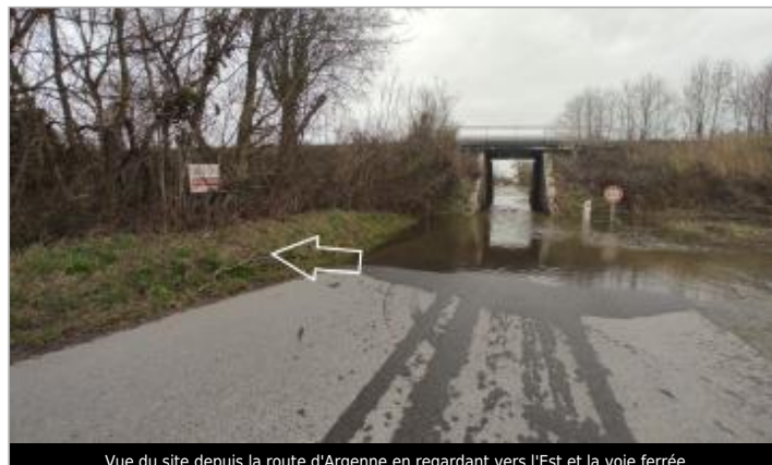
Vue du site depuis la route d'Argenne en regardant vers l'Est et la voie ferrée

GÉOLOCALISATION Coordonnées WGS84 : X: -1.35911679 / Y: 48.64886680 Coordonnées RGF93 (Lambert 93) X: 379043.31 / Y: 6847604.95 Coordonnées RGF93 (ETRS89) : X: -1.3591168 / Y: 48.6488668 Code Hydro: I9294000 Rive de référence: Droite