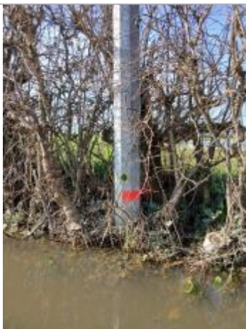
Photo laisse d'inondation