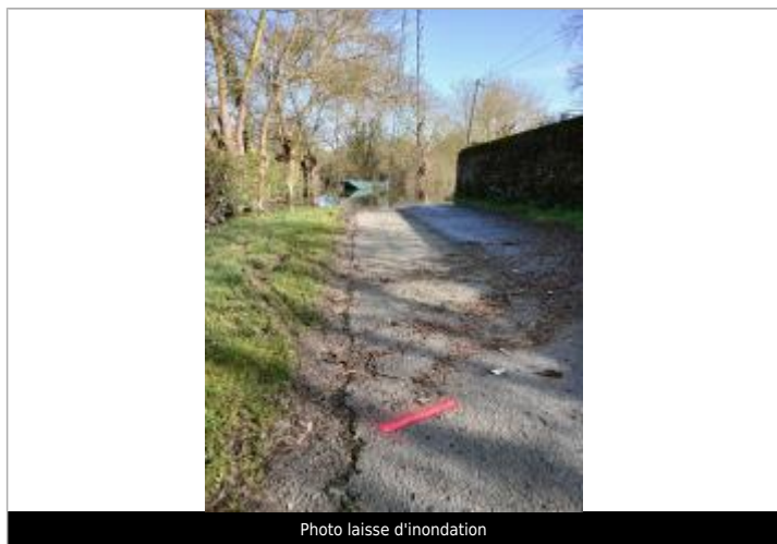
Photo laisse d'inondation