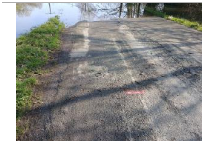
Photo marque d'inondation