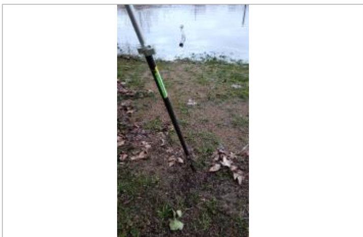
Vue sur la laisse d'inondation