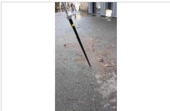
Vue sur la laisse d'inondation