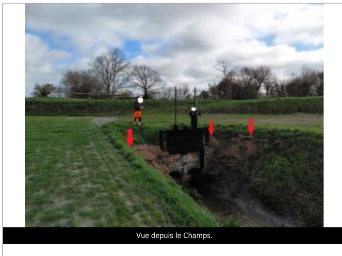
Vue depuis le Champs.