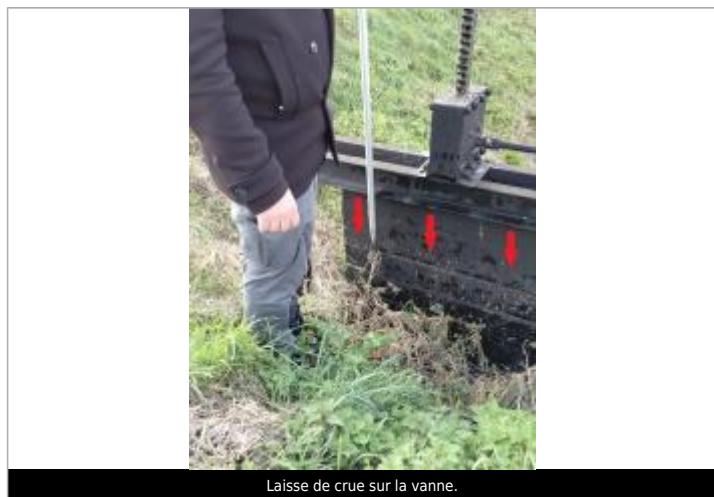
Laisse de crue sur la vanne.

SOURCE DE REPÉRAGE : VISITE DE TERRAIN SPC SACN - 11/03/2020