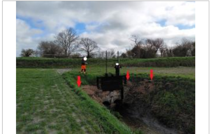
Vue depuis le Champs.