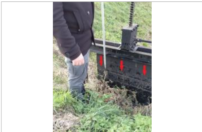
Laisse de crue sur la vanne.