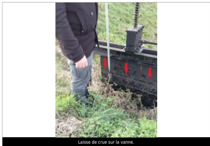
Laisse de crue sur la vanne.

SOURCE DE REPÉRAGE : VISITE DE TERRAIN SPC SACN - 11/03/2020