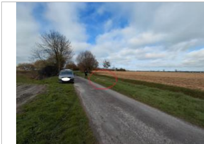
Vue depuis la route des Millardières.