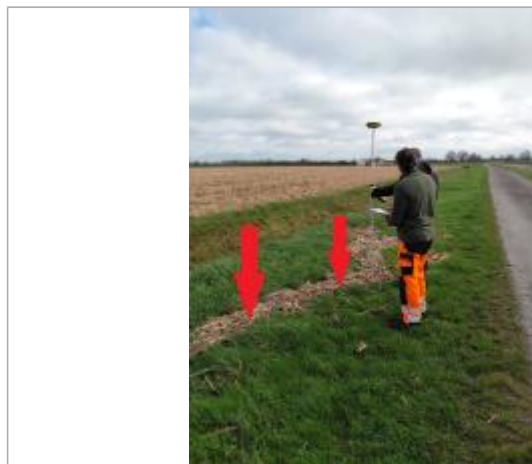
Laisse de crue au sol.

SOURCE DE REPÉRAGE : VISITE DE TERRAIN SPC SACN - 11/03/2020