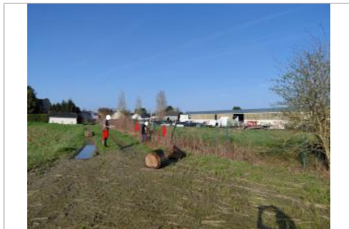
Vue depuis le champs au bout du chemin.

GÉOLOCALISATION Coordonnées WGS84 : X: -1.51141473 / Y: 48.54883430 Coordonnées RGF93 (Lambert 93) X: 367206.77 / Y: 6837132.28 Coordonnées RGF93 (ETRS89) : X: -1.5114147 / Y: 48.5488343 Code Hydro: J0-0150 Rive de référence: Droite