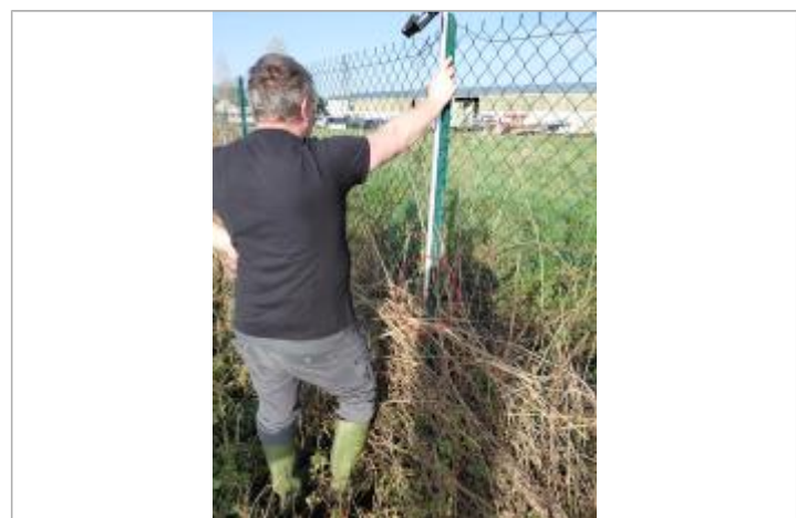
Laisse de crue à 75 cm/sol.

GÉNÉRAL Code : WEB_R_202603110500 Date de mise à jour : 11/03/2026 Auteur : SPC.SACN