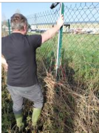
Laisse de crue à 75 cm/sol.

Altitude calculée de l'eau (en m) : 8.34