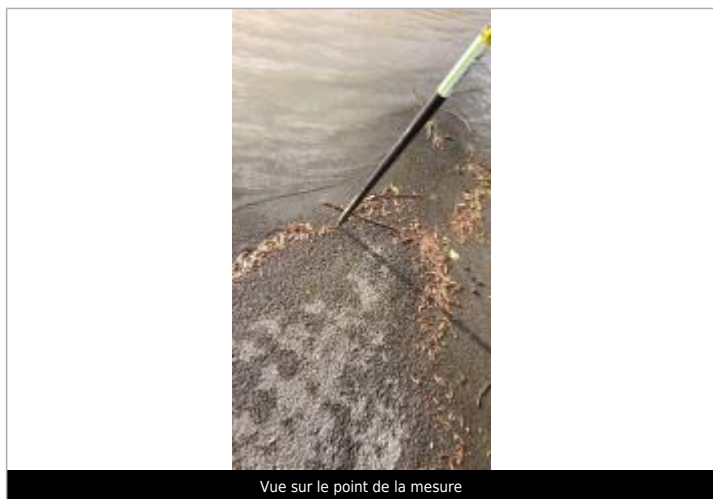
Vue sur le point de la mesure