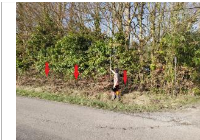
Vue depuis la RD 219.