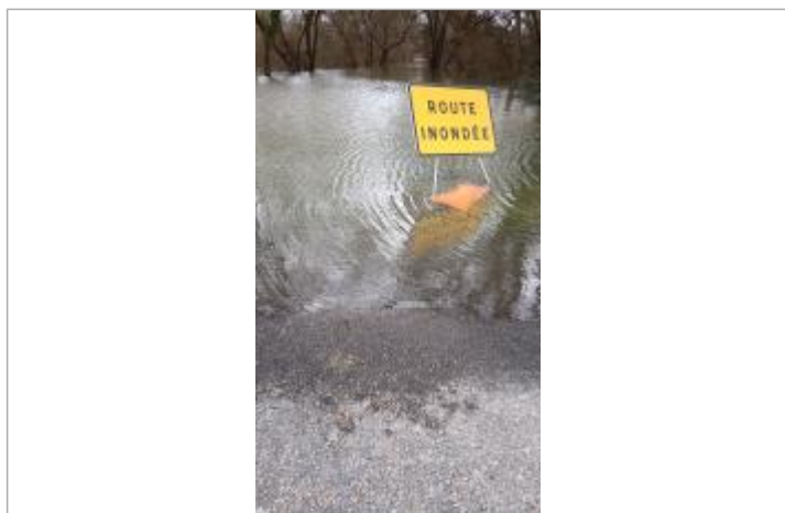
Vue sur la laisse d'inondation