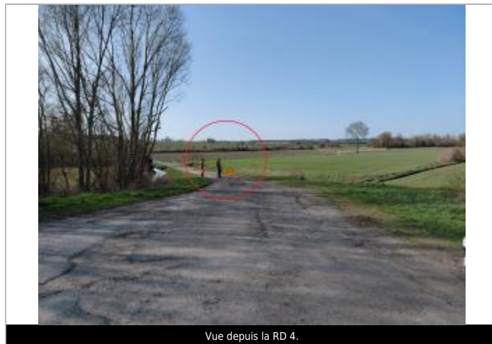
Vue depuis la RD 4.

GÉOLOCALISATION Coordonnées WGS84 : X: -1.53100738 / Y: 48.55386780 Coordonnées RGF93 (Lambert 93) X: 365795.16 / Y: 6837773.67 Coordonnées RGF93 (ETRS89) : X: -1.5310074 / Y: 48.5538678 Code Hydro: J0--0150 Rive de référence: Gauche