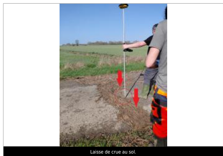
Laisse de crue au sol.

GÉNÉRAL Code : WEB_R_202603060649 Date de mise à jour : 06/03/2026 Auteur : SPC.SACN