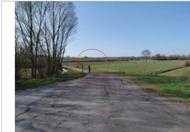
Vue depuis la RD 4.