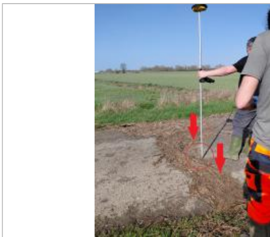
Laisse de crue au sol.

SOURCE DE REPÉRAGE : VISITE DE TERRAIN SPC SACN - 11/03/2020