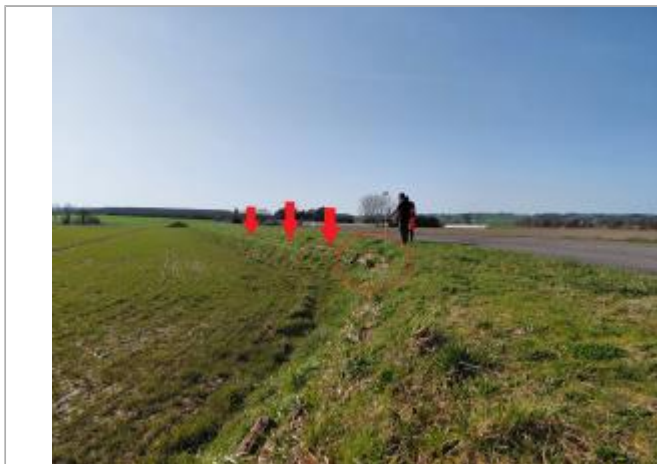
Vue depuis le Chemin du Clos de La Haye (coté RD 997)