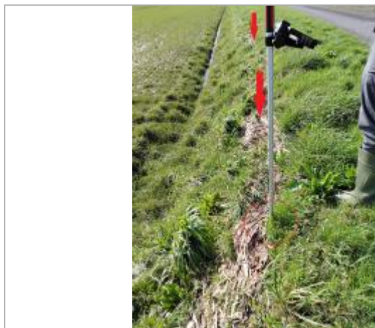
Laisse de crue au sol.

SOURCE DE REPÉRAGE : VISITE DE TERRAIN SPC SACN - 11/03/2020