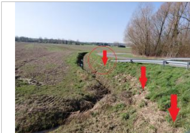
Vue depuis la RD 997.