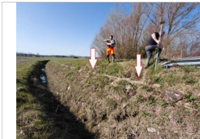
Laisse de crue au sol au pied de la glissière.

SOURCE DE REPÉRAGE : VISITE DE TERRAIN SPC SACN - 11/03/2020