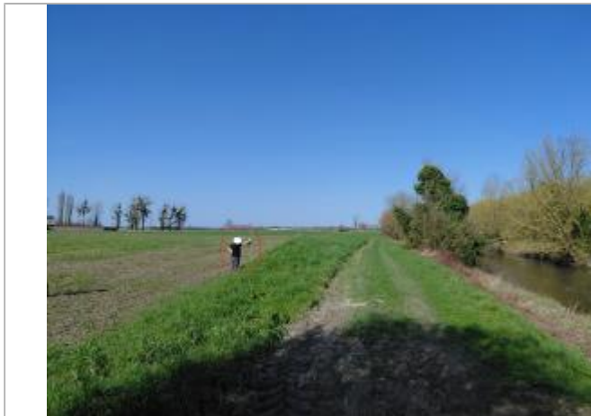
Vue depuis le champs.