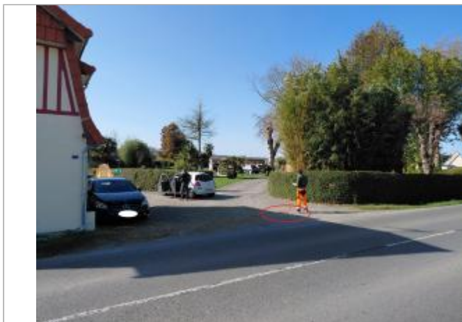
Vue depuis la route Saint Georges.