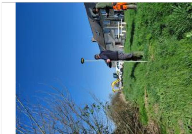
Laisse de crue au sol.

Altitude calculée de l'eau (en m) : 7.41 m