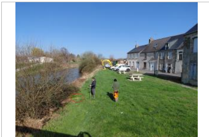
Vue depuis la Passerelle.