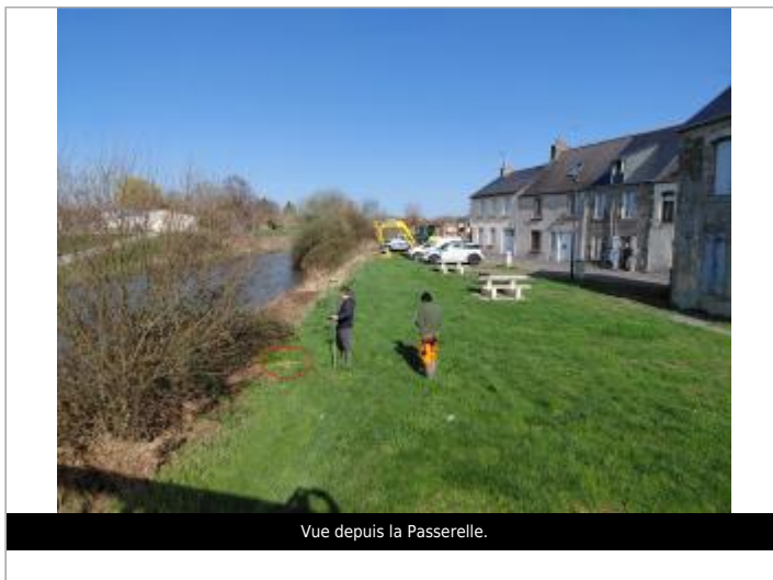
Vue depuis la Passerelle.