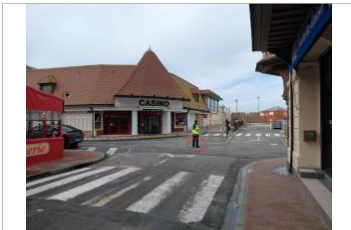
Vue depuis la rue Coty