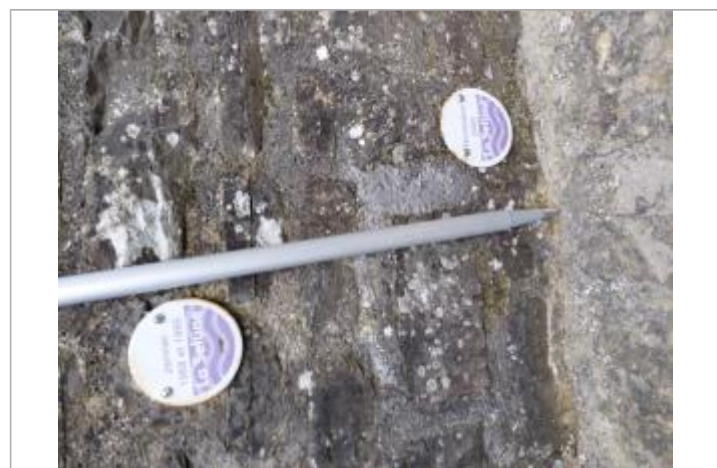
Macaron à 9 cm/sol.