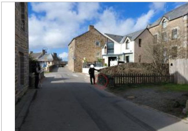
Vue depuis la Grande Rue.