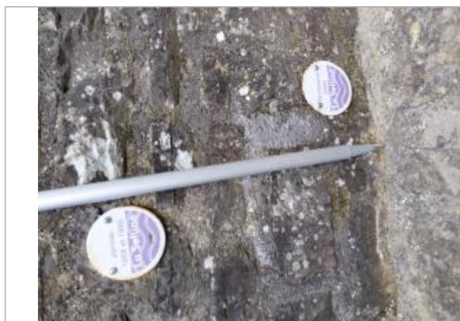
Macaron normalisé à 43 cm/sol.