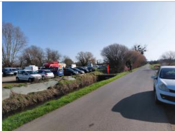
Vue depuis le chemin du Marais.