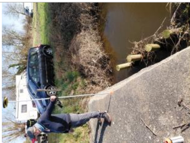
Laisse de crue au sol à 17 cm du bord de la passerelle.

Maximum de l'inondation : Oui Visibilité : Oui État du repère : Moyen Pérennité : Moyenne Repère calculé : Non PHEC : Non renseigné