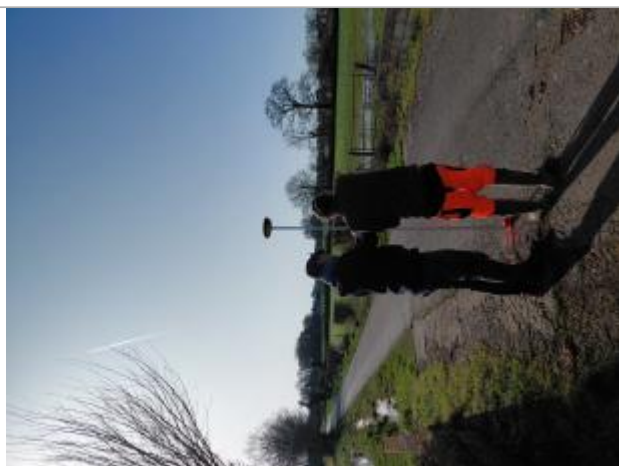
Laisse de crue au sol.

Altitude calculée de l'eau (en m) : 6.94 m