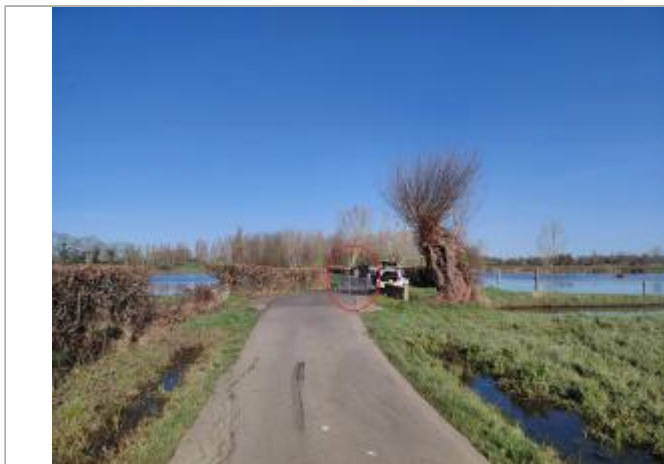
Vue depuis le Chemin du Marais.