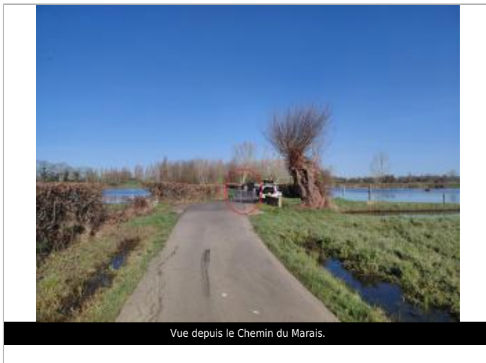
Vue depuis le Chemin du Marais.