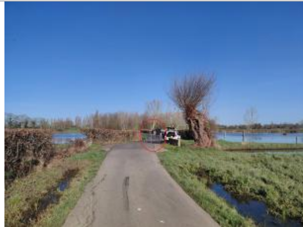
Vue depuis le Chemin du Marais.