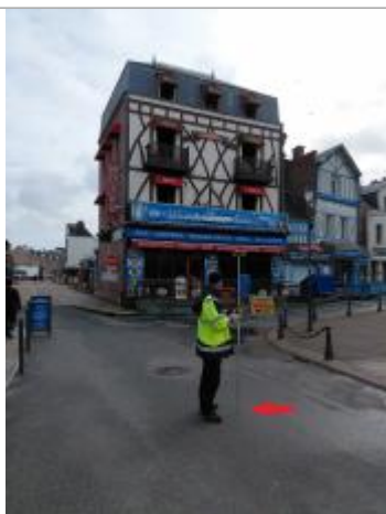
Laisse de mer à 10 cm/sol de la chaussée.

Altitude calculée de l'eau (en m) : 6.46