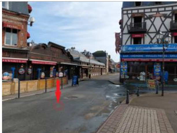
Vue depuis la place du Maréchal Foch