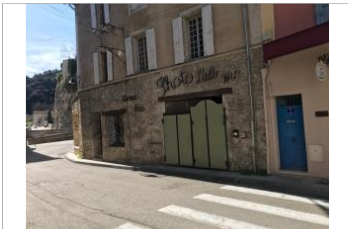
Vue du site, auteur: R. Martin, février 2026