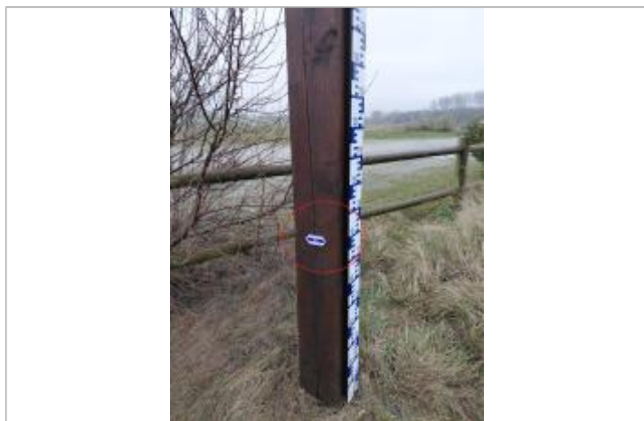
Laisse de crue à 79 cm/sol.

SOURCE DE REPÉRAGE : VISITE DE TERRAIN SPC SACN - 11/03/2020