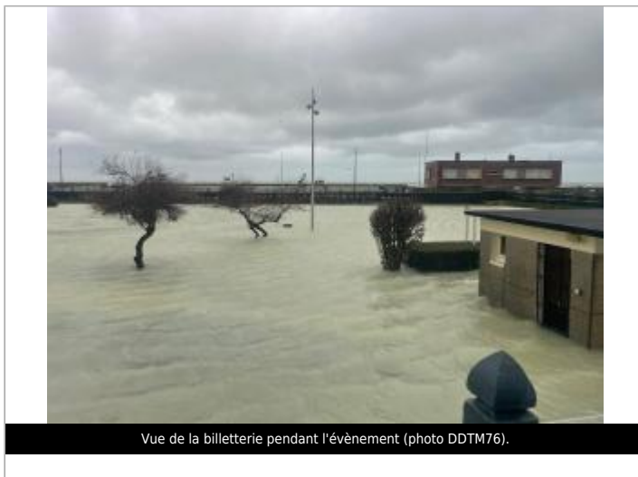
Vue de la billetterie pendant l'évènement.