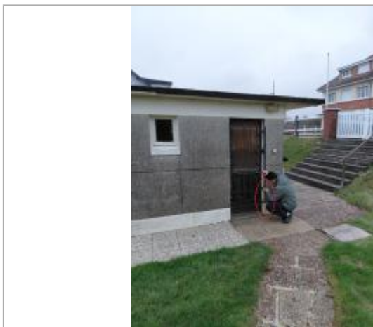
Laisse de mer à 56 cm/sol.

SOURCE DE REPÉRAGE : VISITE DE TERRAIN SPC SACN - 11/03/2020