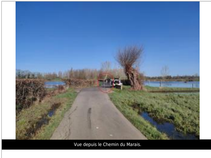
Vue depuis le Chemin du Marais.