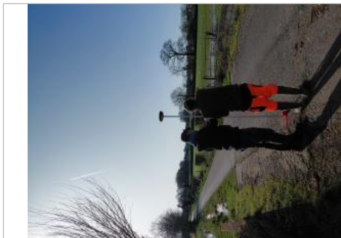
Laisse de crue au sol.

SOURCE DE REPÉRAGE : VISITE DE TERRAIN SPC SACN - 11/03/2020