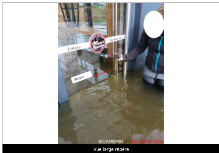
Vue large repère