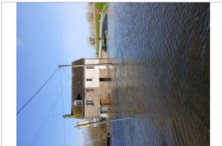
Vue site plan large