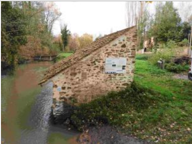
Repère de crue du 12 juin 2018 de la Rémarde à Saint Cyr sous Dourdan