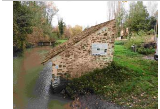
Repère de crue du 12 juin 2018 de la Rémarde à Saint Cyr sous Dourdan