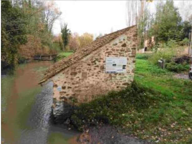
Repère de crue du 12 juin 2018 de la Rémarde à Saint Cyr sous Dourdan