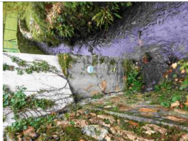
Repère de crue du 18 juin 2018 du Petit Muce à Forges les Bains