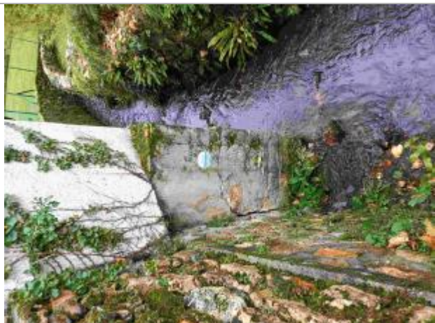
Repère de crue du 18 juin 2018 du Petit Muce à Forges les Bains