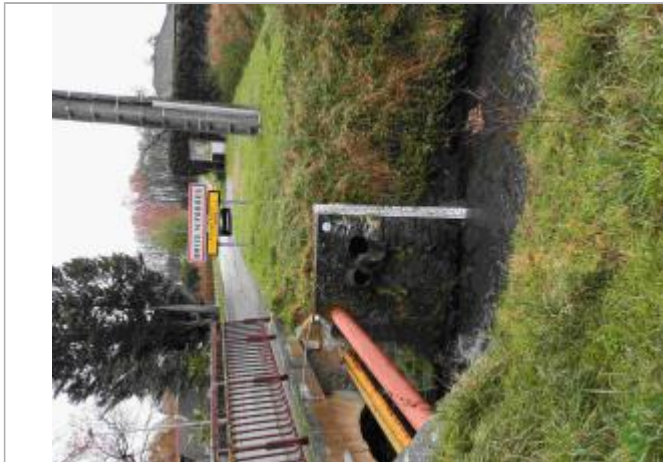
Repère de crue du 12 juin 2018 de la Prédecelle à Briis sous Forges