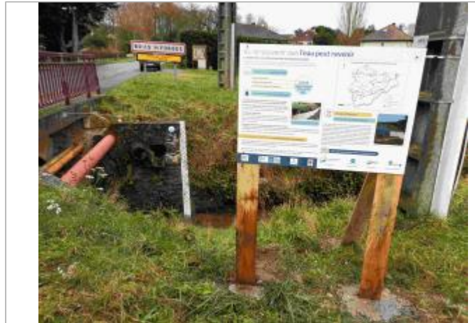
Repère de crue du 12 juin 2018 de la Prédecelle à Briis sous Forges