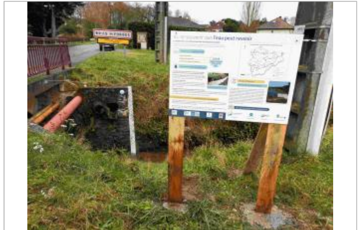
Repère de crue du 12 juin 2018 de la Prédecelle à Briis sous Forges