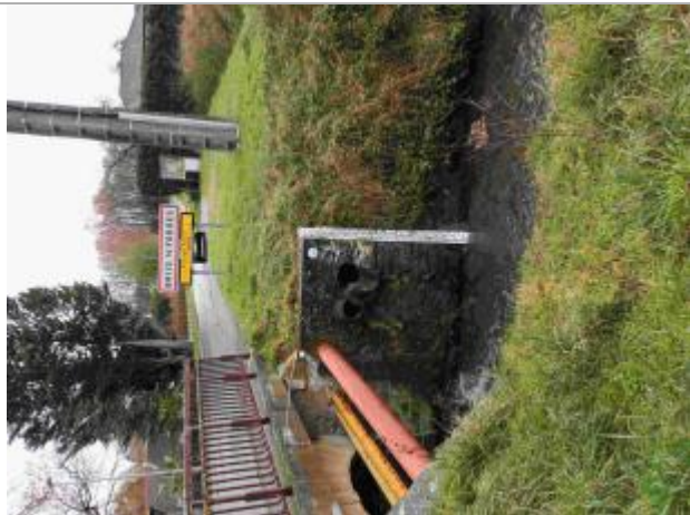
Repère de crue du 12 juin 2018 de la Prédecelle à Briis sous Forges