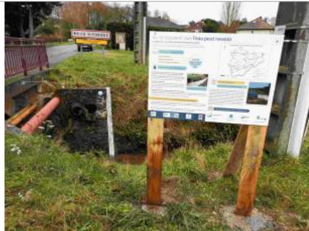
Repère de crue du 12 juin 2018 de la Prédecelle à Briis sous Forges