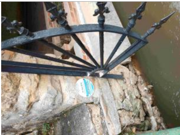
Repère de crue du 31 mai 2016 de la Rémarde à Breuillet