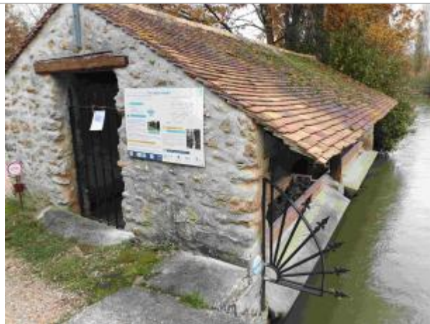
Repère de crue du 31 mai 2016 de la Rémarde à Breuillet